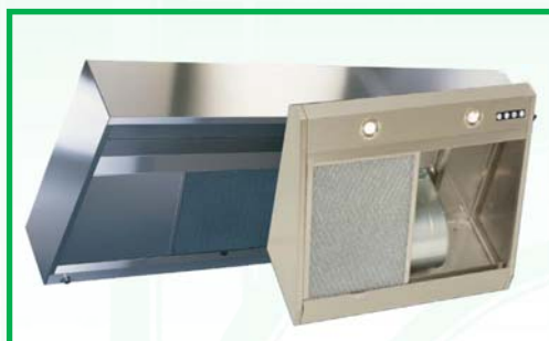
Hotte simple flux statique ou dynamique