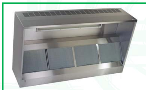
Hotte à induction