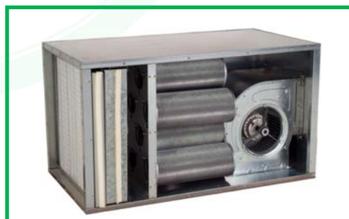
Caisson de filtration charbon

ETUDES, PRIX ET CARACTERISTIQUES NOUS CONSULTER