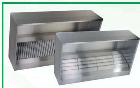
Hotte four et laverie